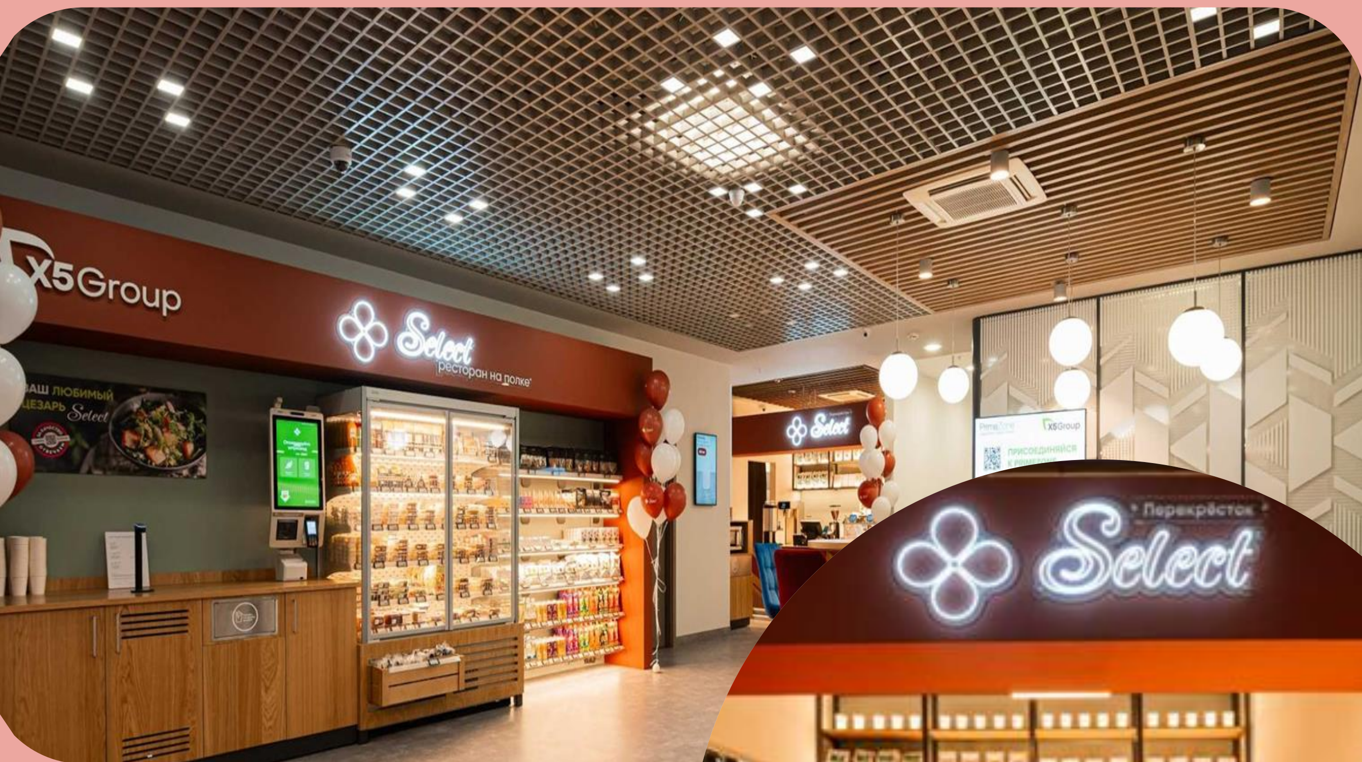
КАФЕ SELECT В БИЗНЕС-ЦЕНТРЕ «ОАЗИС»