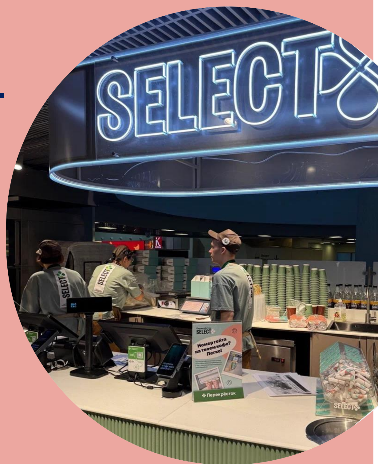
КАФЕ SELECT В АЭРОПОРТУ ПУЛКОВО